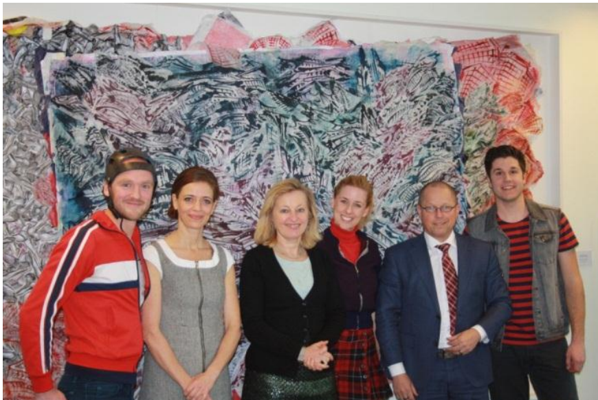
De cast van Zuikerleech met minister Jet Busemakers en Gedeputeerde Ger Koopmans

Het Laagland heeft in 2016 daarnaast 14 overige activiteiten gerealiseerd met 1.396 bezoekers. Hier gaat het onder meer om het Kindermonument 2016 , Zaterdag Hoogwaterdag van Jong Laagland en de presentatiedag van Talent 3 , lezingen van de voorstelling-in-words Flik Flak in samenwerking met VIA ZUID en een speciale uitvoering van Zuikerleech op het Ministerie van OCW ter gelegenheid van de ondertekening van het Cultuurconvenant 2017-2020.