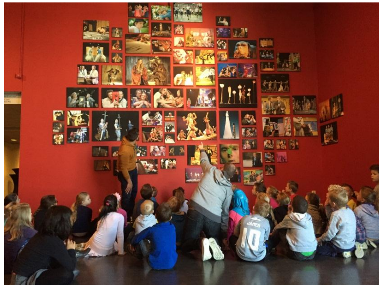
Schoolklas bij de fotowand van Het Laagland in Schouwburg De Domijnen.