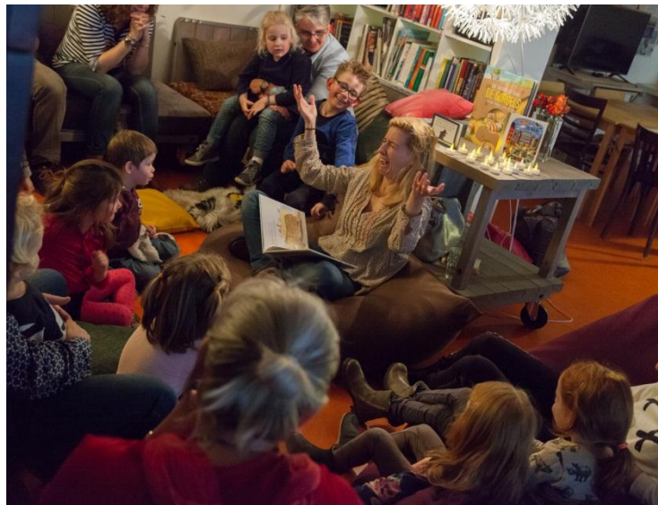
De Huiskamer van Het Laagland