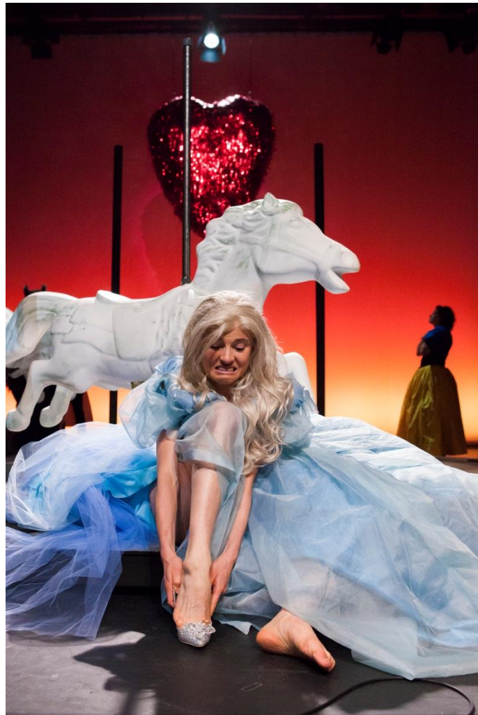
De Prins op Het Knappe Paard